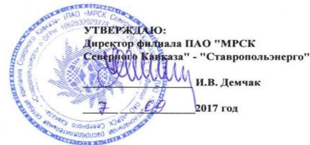
ГРАФИК ограничения режима потребления электрической мощности, на 2017/2018 гг. по Филиалу ПАО "МРСК Северного Кавказа" - "Ставропольэнерго" на территории Ставропольского края